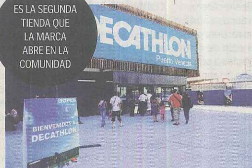
◆ MODA DEPORTIVA Equipación para el deporte en Decathlon.

KIABI ES LA SEGUNDA TIENDA QUE LA MARCA ABRE EN LA COMUNIDAD