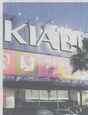
◆ AMPLITUD El establecimiento de Kiabi cuenta con una superficie de 1.342 metros cuadrados.

BUENOS PRECIOS La tienda líder en moda infantil ofrece cada dos semanas una selección de artículos a 'precios rotos'. Kiabi proporciona a cada uno la moda con la que sueña a los precios que desea. La multinacional fue fundada en 1978 en Francia y es líder allí de las grandes superficies especializadas en textil. En España también está en el 'top ten' en cuota de mercado.