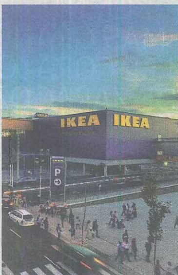
◆ IKEA Todo para el hogar.

KIABI Y DECATHLON, LAS ÚLTIMAS INCORPORACIONES EN MODA Y DEPORTE