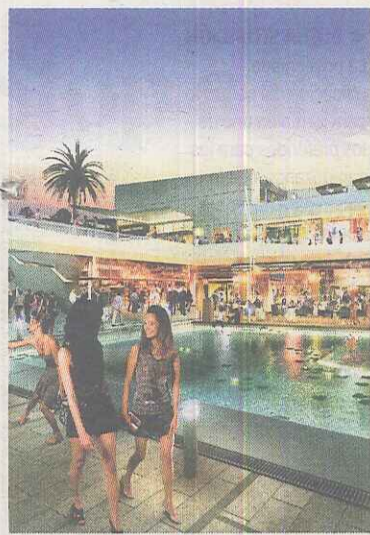
◆ CANAL DE NOCHE Ocio a todas horas.

EL ESPACIO COMBINARÁ DE FORMA CREATIVA LA OFERTA COMERCIAL Y DE OCIO, RECREACIÓN Y AVENTURA. EL RECINTO CONTARÁ CON UN LAGO PARA PRACTICAR ACTIVIDADES ACUÁTICAS Y OTROS DEPORTES COMO LA TIROLINA