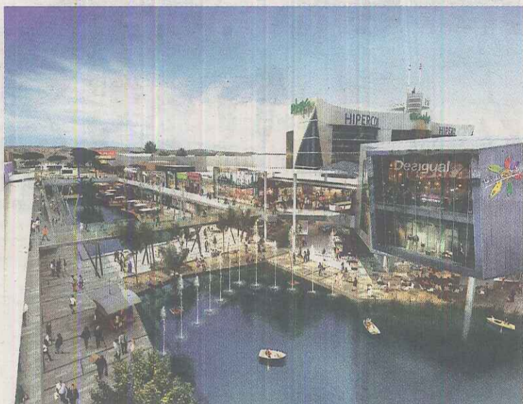
◆ VARIEDAD Vista aérea del canal y acceso a la galería de moda.

EL PARQUE INCLUYE TRES ZONAS INFANTILES Y OFRECE TODOS LOS SÁBADOS TALLERES PARA LOS MÁS PEQUEÑOS