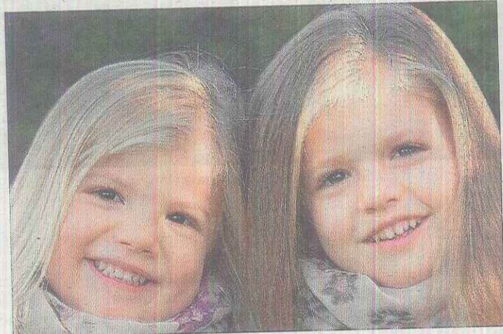
Las infantas Sofía y Leonor aparecen en la felicitación de los Príncipes.

Ante la catedral de Santiago posó la infanta Elena con sus hijos. Un acompañante tomó la fotografía, en la que los tres aparecen con el bordón y la vieira. Bajo la impresión "Feliz Navidad y Feliz Año Nuevo", también en francés e in-