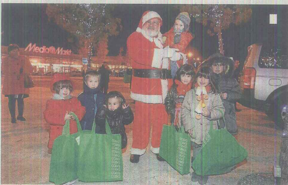
►►Escenas► Arriba, el ayudante de Santa, en el encendido. Abajo, algunos niños, en el acto.